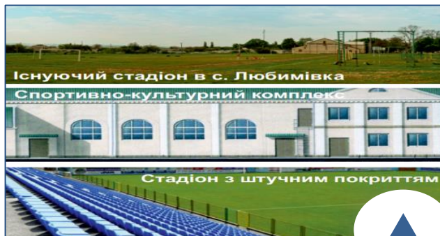
Існуючий стадіон в с. Любимівка