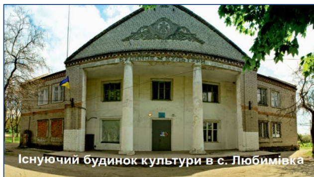
Існуючий будинок культури в с. Любимівка