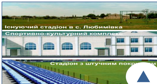
Існуючий стадіон в с. Любимівка