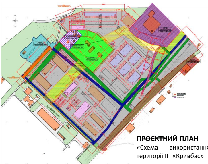
ПРОЄКТНИЙ ПЛАН «Схема використання території ІП «Кривбас»»

Термін, на який створено ІП – 30 років (2013 - 2043 рр.)