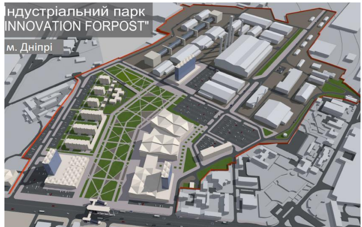
СХЕМА ЗОНУВАННЯ ТЕРИТОРІЇ